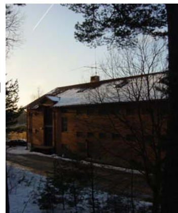
Vintern är snart här, klubbhuset i vinterskrud